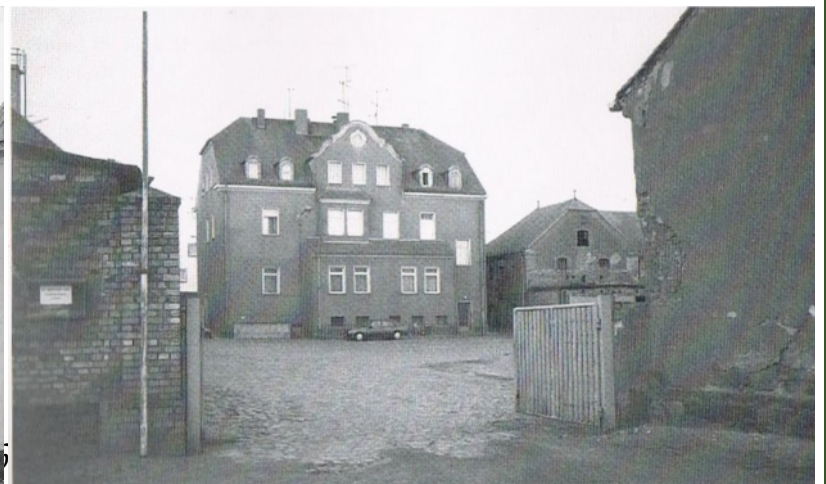
Das Volksgut um 1990