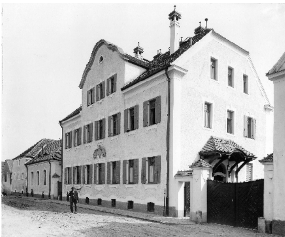
Das Graßdorfer Rittergut zur Jahrhundertwende